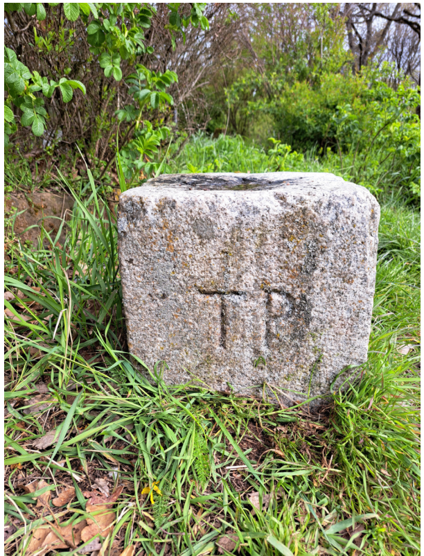
Bild rechts: Blick auf den Tri- gonometrischen Punkt (TP) auf dem Kalmitgipfel rechts vom Treppenaufgang im Jahre 2024.

Die zweite Frage ist nicht ganz so einfach zu beantworten. Denn wo sich der höchste Punkt auf dem Gipfel befindet, ist „Definitionssache“. Bei der Beantwortung dieser Frage konnte das Landesamt für Vermessung und Geobasisinformation in Koblenz helfen. Drei Mitarbeiter reisten am Donnerstag, den 19. September 2024, um 11 Uhr vormittags mit