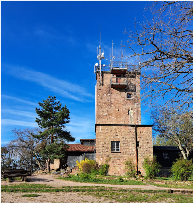
Bild links: Blick auf den Kalmiturm von Norden, dahinter die Hütte des Pfälzerwald-Vereins Ortsgruppe Ludwigshafen-Mannheim. Die Aufnahme stammt vom Mittwoch, den 10. April 2024.

Sehen Sie dazu auch: Hogrefe, Alexander, IN: "Die Rheinpfalz", Abschnitt: Südwestdeutsche Zeitung vom 13. November 2024.