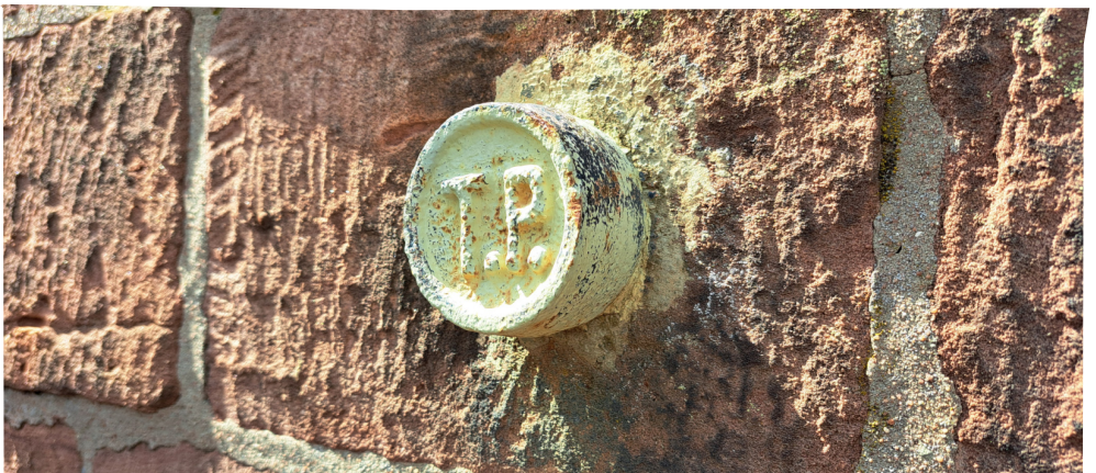
Bild oben: Blick auf den Trigonometrischen Punkt (TP) auf dem Kalmitgipfel in der Vorderwand des Kalmitturmes (Ostseite - hinter der Bank; auf einer Höhe von 171 Zentimetern) im Jahre 2024.

Außerdem werden, um Höhen im amtlichen System zu bestimmen, Höhenfestpunkte benötigt. Das sind amtlich vermessene Punkte, deren Höhe schon bekannt ist. Auf der Kalmit sind dies zum Beispiel der Basaltpfiler mit einem quadratischen Kopf rechts des Treppenaufgangs zum Turm. Erkennbar ist dieser (Bild links) an den seitlich eingemeißelten Buchstaben TP (trigonometrischer Punkt). Auf der Oberseite ist ein eingeritztes Kreuz zu erkennen. Über einem dieser Punkte wurde die Nivellierlatte aufgesetzt.