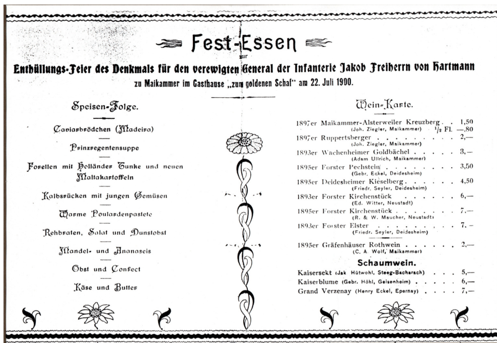
Bild oben: Menükarte Fest-Essen zur Enthüllungs-Feier des Denkmals für den verewigten General der Infanterie Jakob Freiherrn von Hartmann zu Maikammer im Gasthause "zum goldenen Schaf" am 22. Juli 1900.

Den Beitrag im Internet zum Denkmal finden Sie hier: https://www.kuladig.de/Objektansicht/KLD-272333 oder unter dem Suchbegriff: General Hartmann.